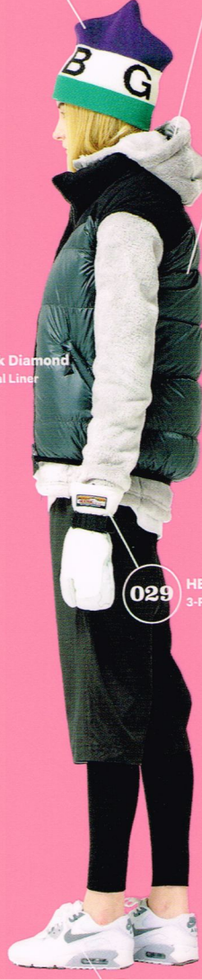
029 HESTRA 3-FINGER FULL LEATHER