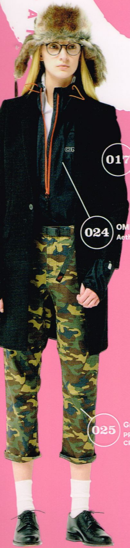
017 ARC'TERYX Beta AR Jacket